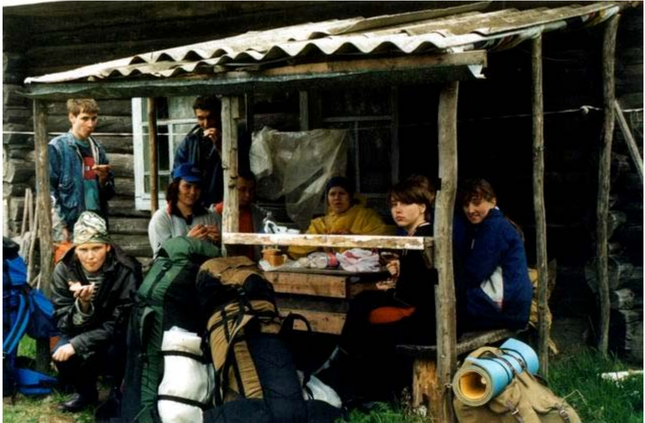
"Мы устали и хотели есть"(сало)

Пропахав 8,5 км, мы наконец выяснили, что идём не туда. В деревне Азарово.