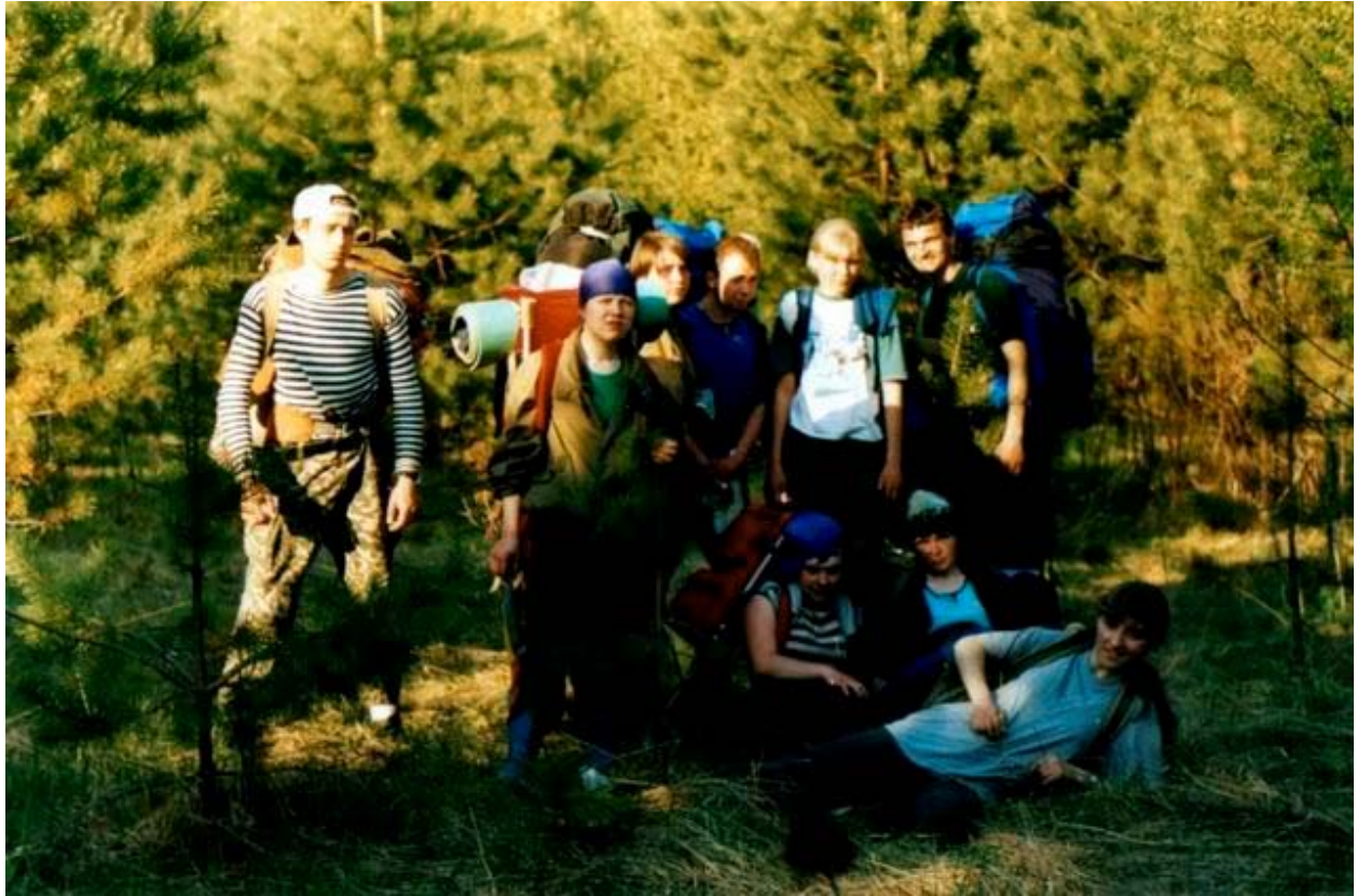
"Групповое фото на память"