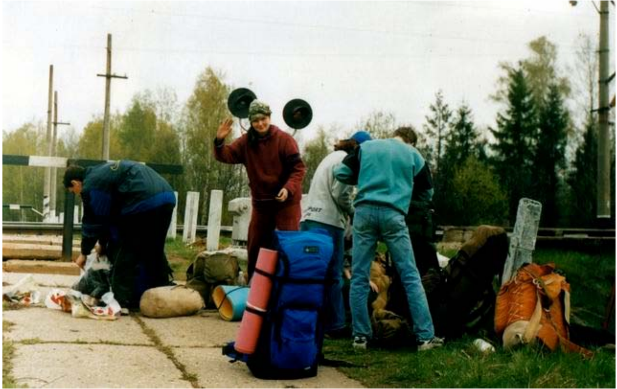
"Сборы в дорогу"

Остановочный пункт 273 км. Сфотографироваться напротив названия станции мы, конечно, забыли.