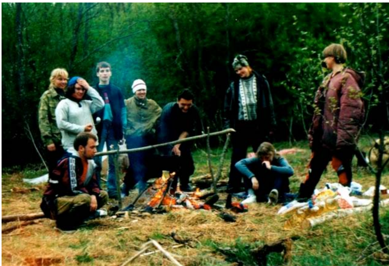
Первая стоянка. "Все счастливы и довольны"(Пока)

Невдалеке от деревни Бушуково. Хотя и не там, где надо, но всё же хорошо. За день прошли 14 км.