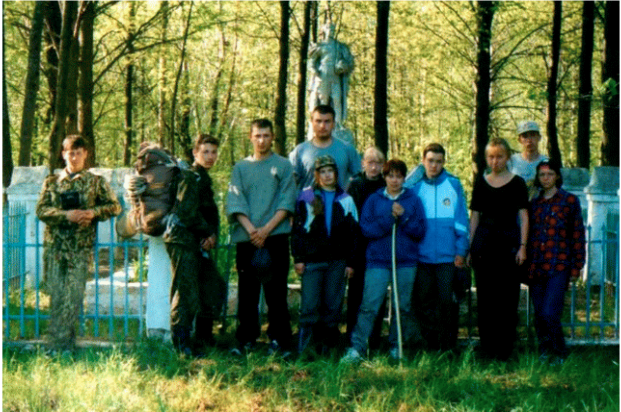
По местам боевой славы. д. Оселье.

Прошли д. Любогоща, по мосту перешли через р. Угра к д. Жули. Далее: Высокое, Оселье. Шли к урочищу Стаицкое, но его только коснулись, срезав путь. Пересекли р. Ужрепт, прошли д. Шимени, д. Речица, д. Терентьево. В д. Замошье остановились на ночёвку. Из д. Оселье сделали выход в д. Глотовка.