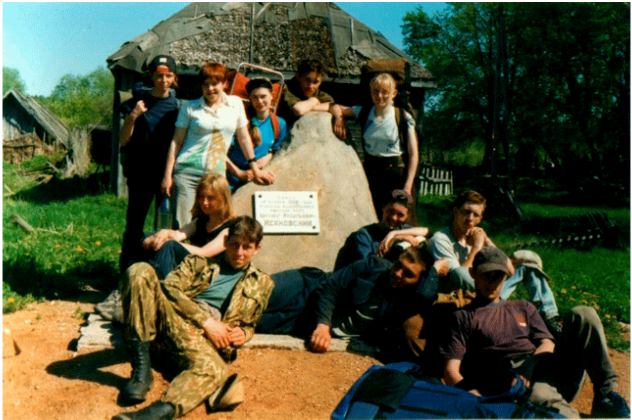
Деревня Глотовка Угранского района. Родина М. В. Исаковского.

Здесь 19 января 1900 года родился выдающийся русский поэт Михаил Васильевич Исаковский.