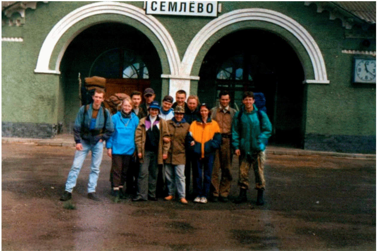
Станция семлёво - начало маршрута.

Электричка Смоленск - Вязьма. Высадились на ст. Семлёво, откуда начался наш маршрут.